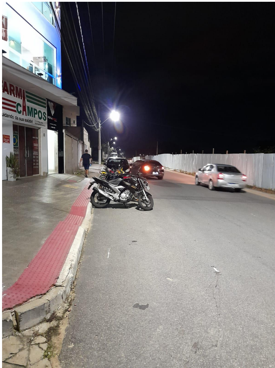
Imagem 04 – Avenida Roberto Marinho