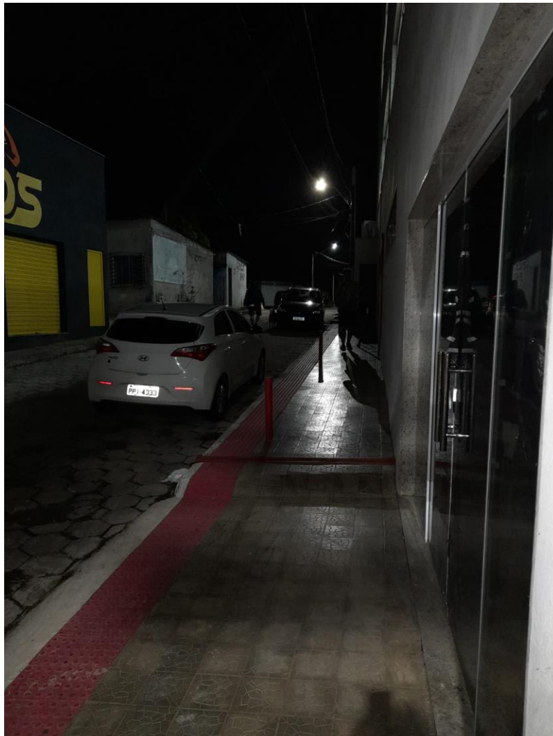
Imagem 03 - Rua Renan Elias Bravin