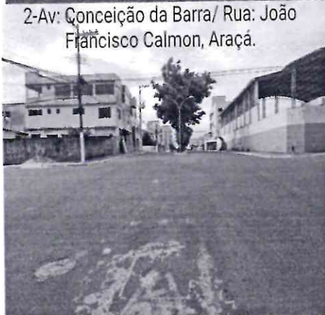
2-Av: Conceição da Barra/ Rua: João Francisco Calmon, Araçá.