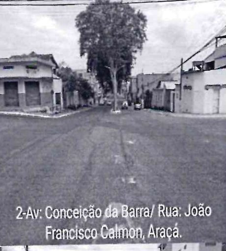
2-Av: Conceição da Barra/ Rua: João Francisco Calmon, Araçá.