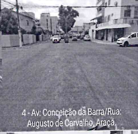
4 - Av: Conceição da Barra/Rua: Augusto de Carvalho, Araçá.