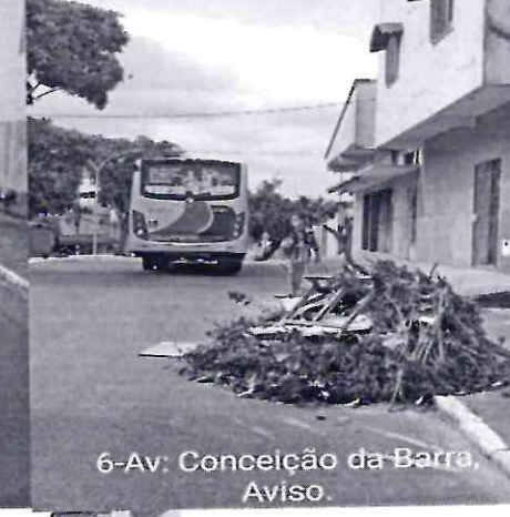
6-Av: Conceição da Barra, Aviso.