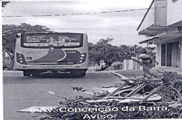
6-Av: Conceição da Barra, Aviso.