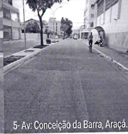
5- Av: Conceição da Barra, Araçá.