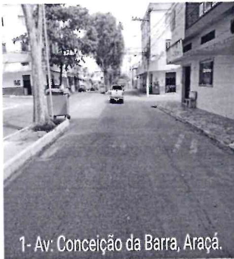
1- Av: Conceição da Barra, Araçá.