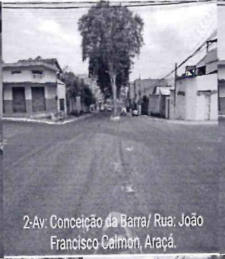
2-Av: Conceição da Barra/ Rua: João Francisco Calmon, Araçá.