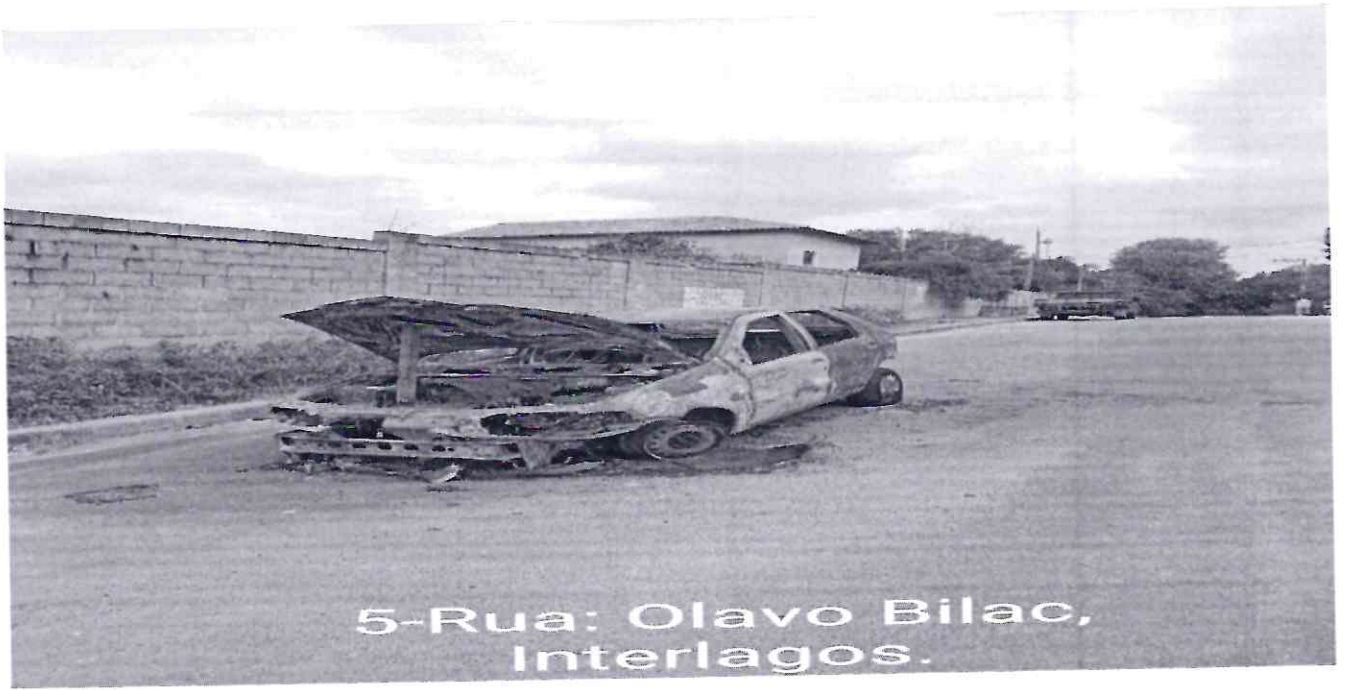
5-Rua: Olavo Bilac, Interlagos.