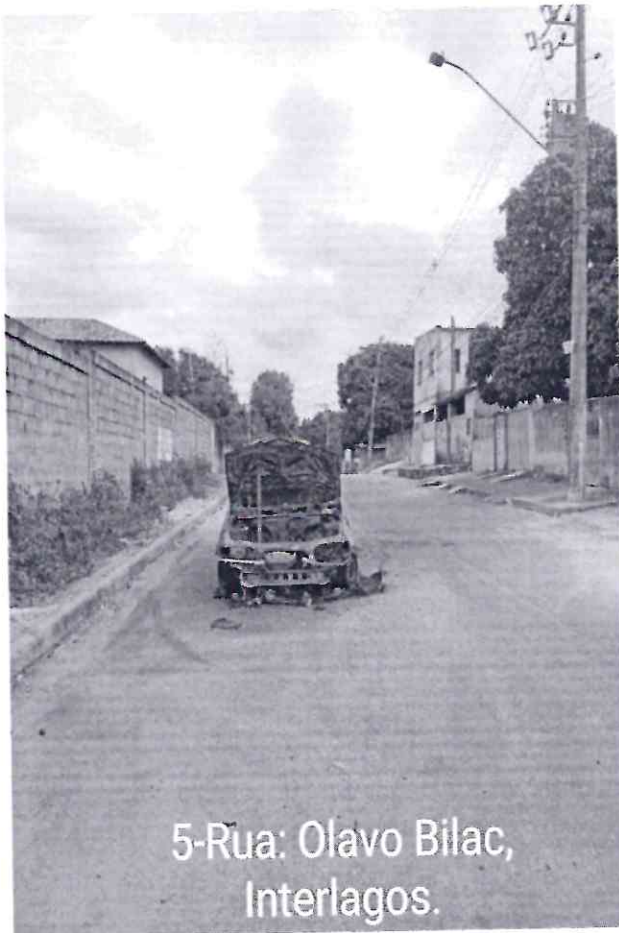
5-Rua: Olavo Bilac, Interlagos.