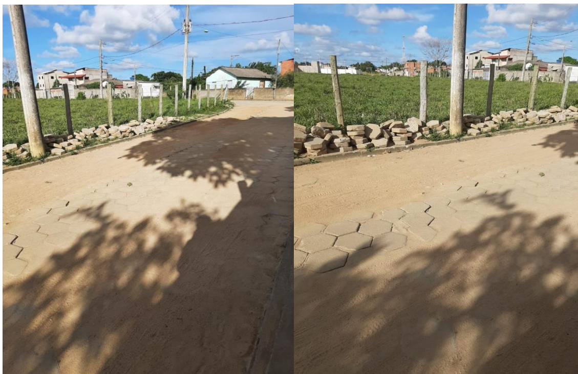
Rua Antônio Jovita Ferreira, próximo ao Complexo Esportivo, no distrito de Bebedouro.