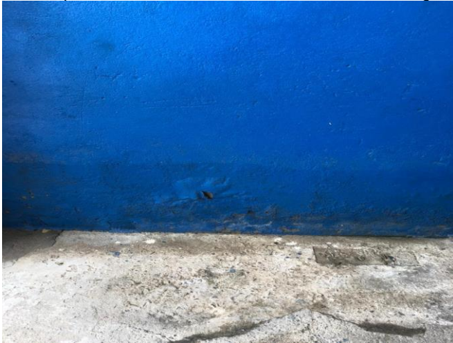
Foto de uma Residência, Rua Perci Carvalho, onde a água da chuva chegou a 30 cm.

Foto da parede da Oficina, Rua Perci Carvalho, onde a água da chuva chegou a 50 cm.