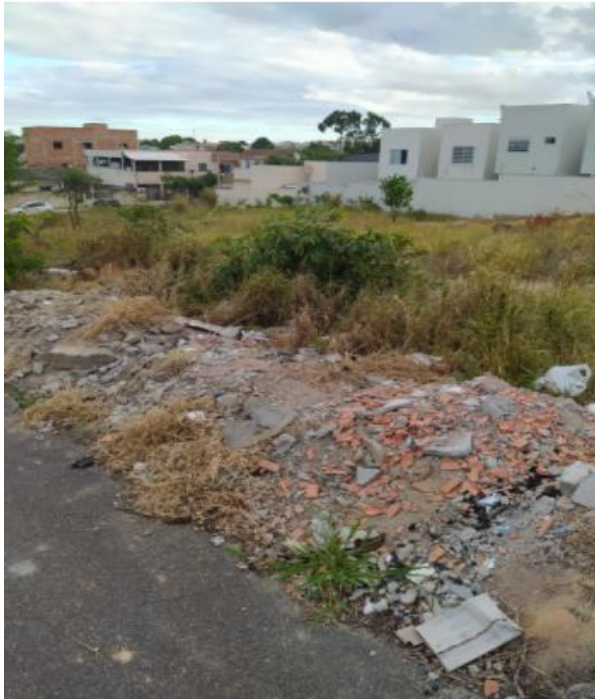
Descarte de entulho

A queimada gera transtornos que vão desde a poluição do ar (com a fuligem e a fumaça) até o aumento da sensação de que o lote não recebe a devida manutenção, ou seja, continua sendo um espaço de risco social e de depósito de entulhos (uma atitude igualmente ilegal), como bem demonstra a imagem abaixo.