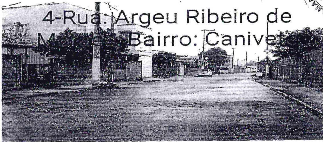
4-Rua: Argeu Ribeiro de Mendes Bairro: Canivete