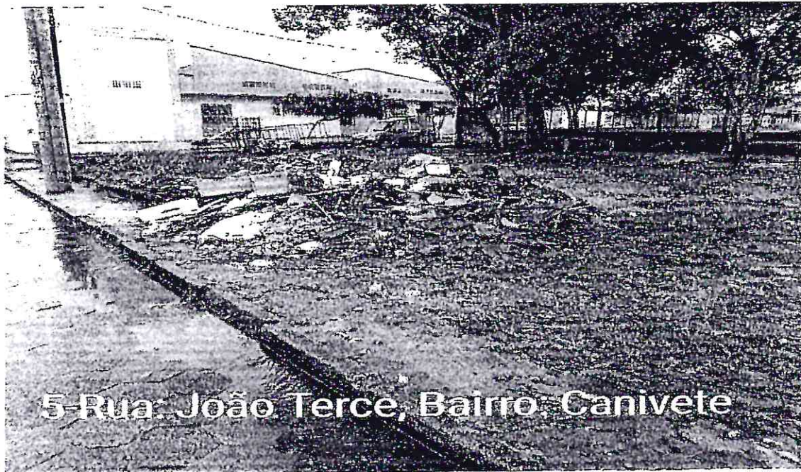
5-Rua: João Terce, Bairro: Canivete