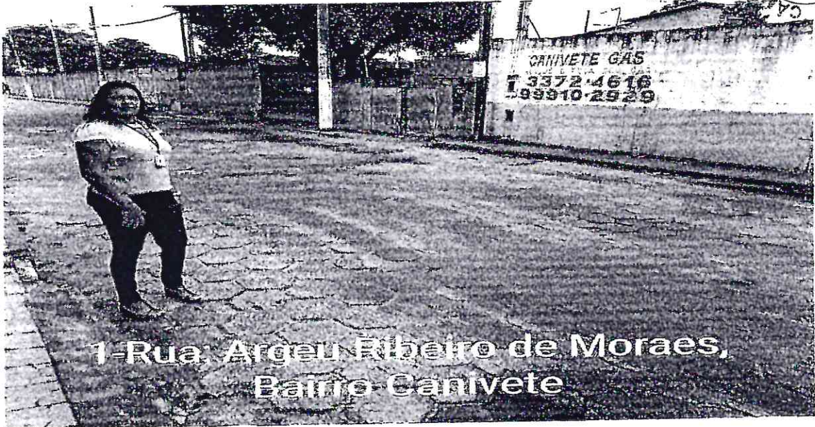
1-Rua: Argeu Ribeiro de Moraes, Barro Canivete