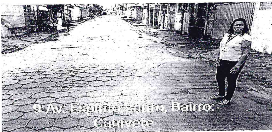
9- Av. Esporte, Bairro: Canivete