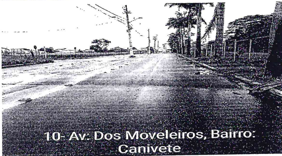
10- Av: Dos Moveleiros, Bairro: Canivete