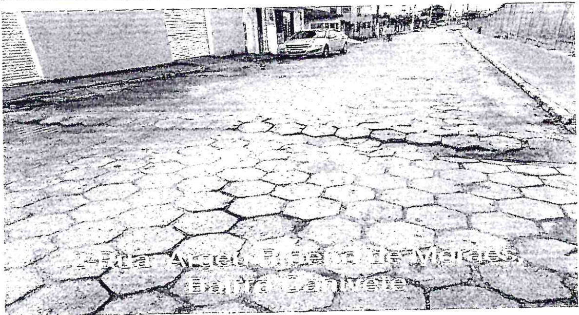
Rua Argeu Ribeiro de Moraes Barro Canivete