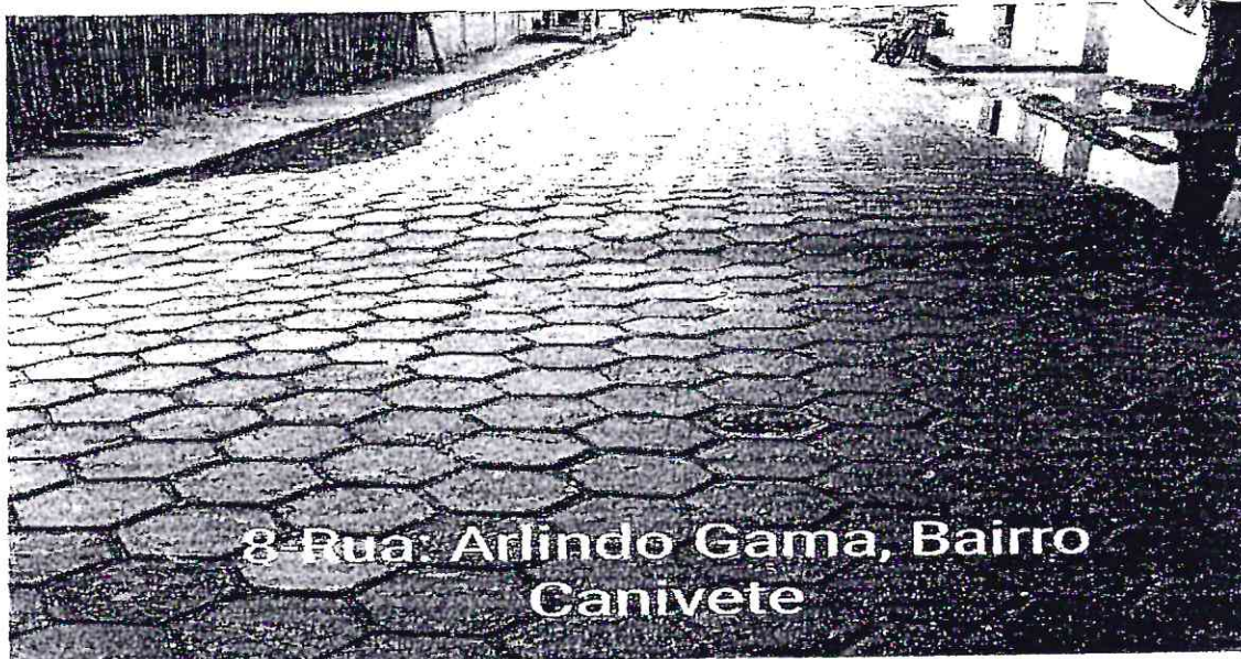
8- Rua: Arlindo Gama, Bairro: Canivete