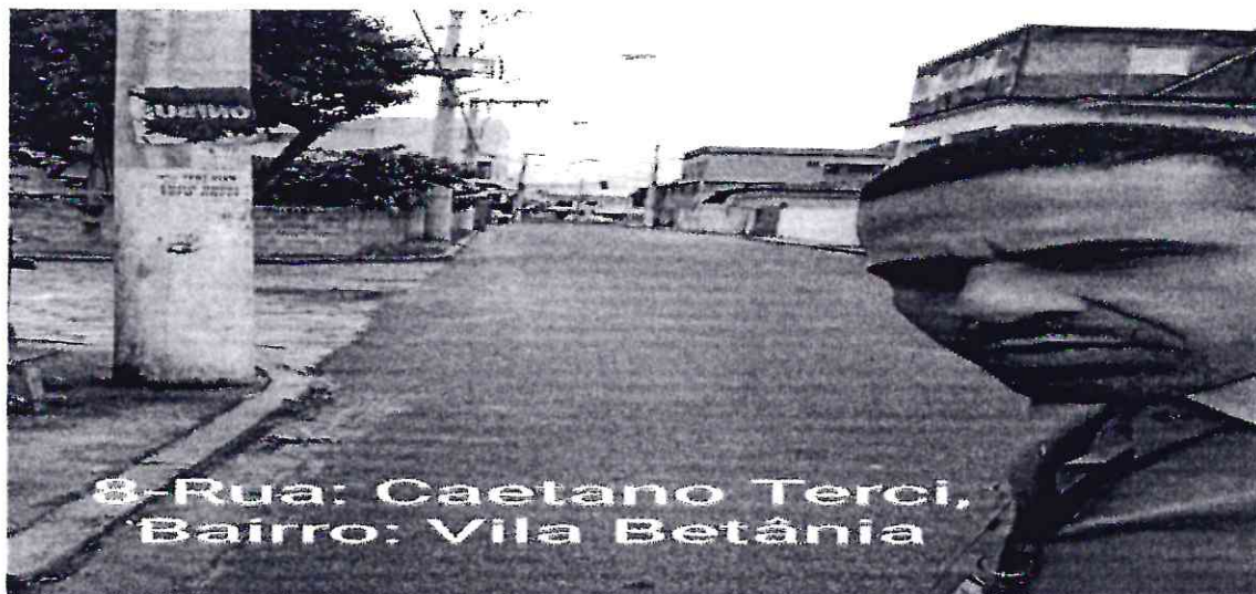
8-Rua: Caetano Terceiro, Bairro: Vila Betânia