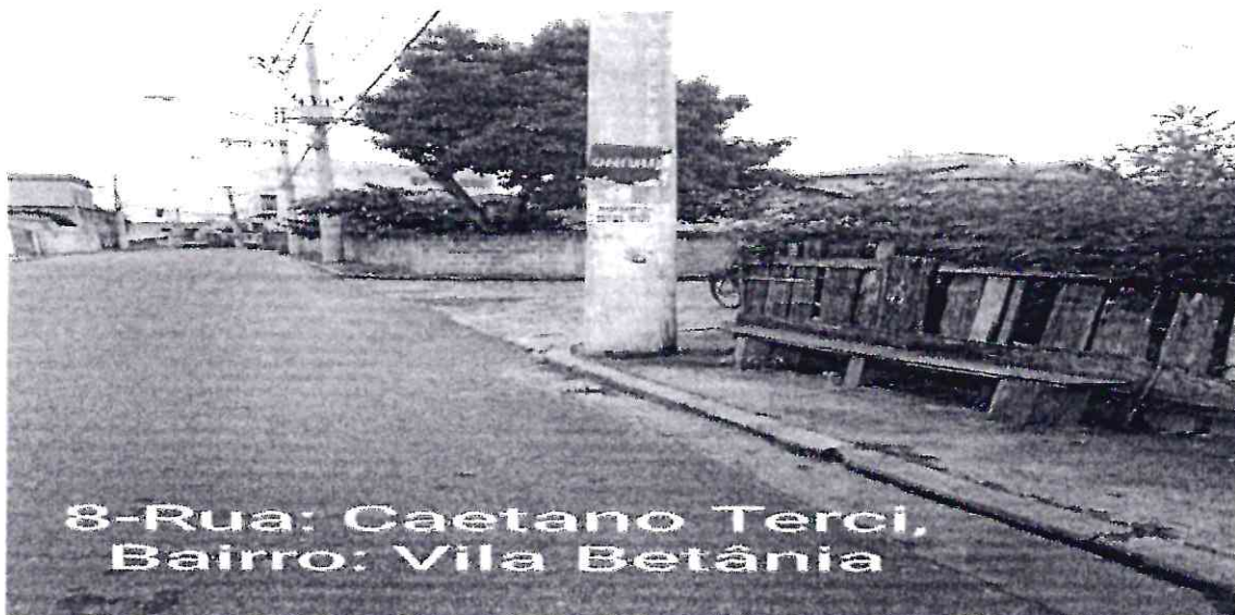
8-Rua: Caetano Terceiro, Bairro: Vila Betânia