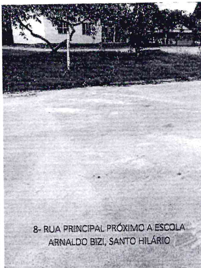
8- RUA PRINCIPAL PRÓXIMO A ESCOLA ARNALDO BIZI, SANTO HILÁRIO