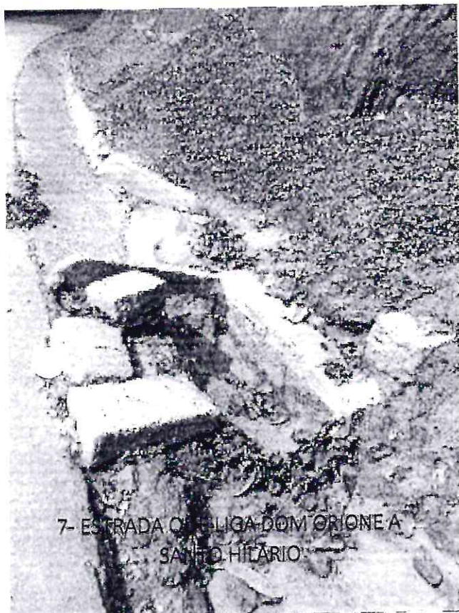
7- ESTRADA QUE LIGA DOM ORIONE A SANTO HILÁRIO