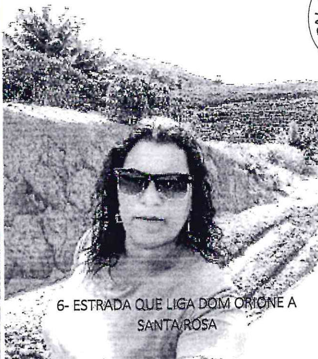
6- ESTRADA QUE LIGA DOM ORIONE A SANTA ROSA