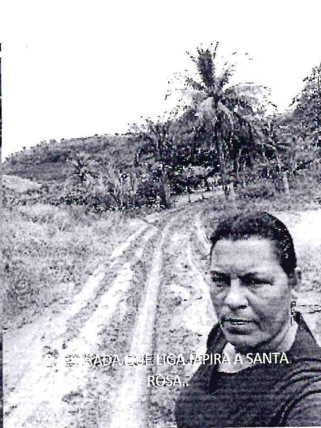
2- ESTRADA QUE LIGA JAPIRA A SANTA ROSA.