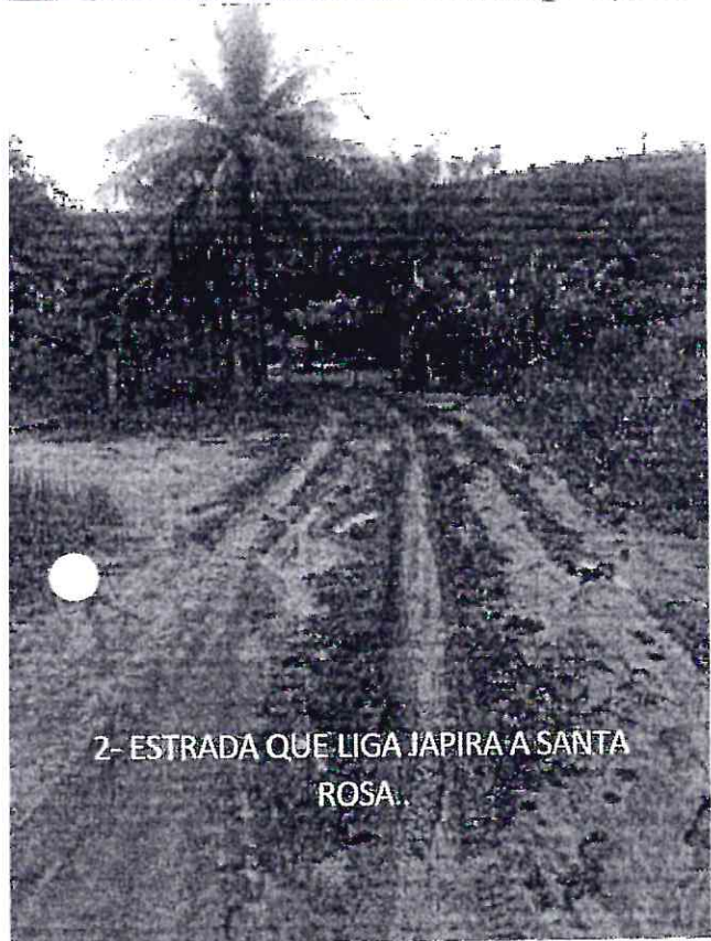
2- ESTRADA QUE LIGA JAPIRA A SANTA ROSA.