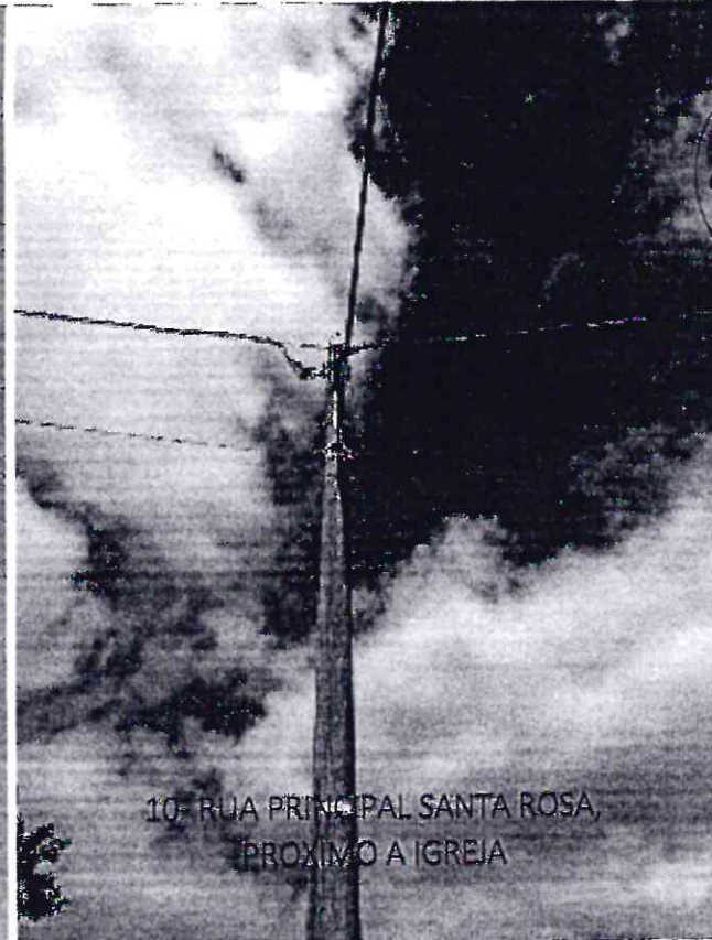
10- RUA PRINCIPAL SANTA ROSA, PROXIMO A IGREJA