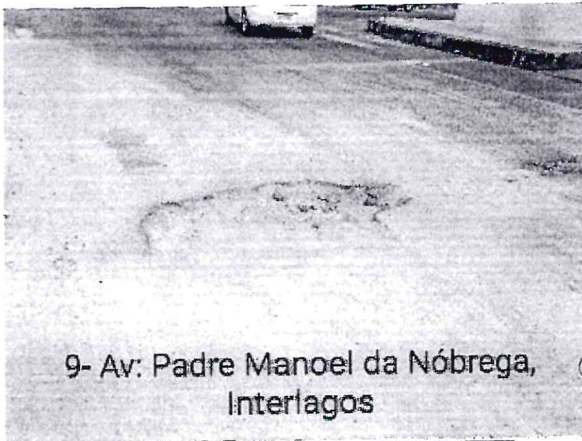
9- Av: Padre Manoel da Nóbrega, Interlagos