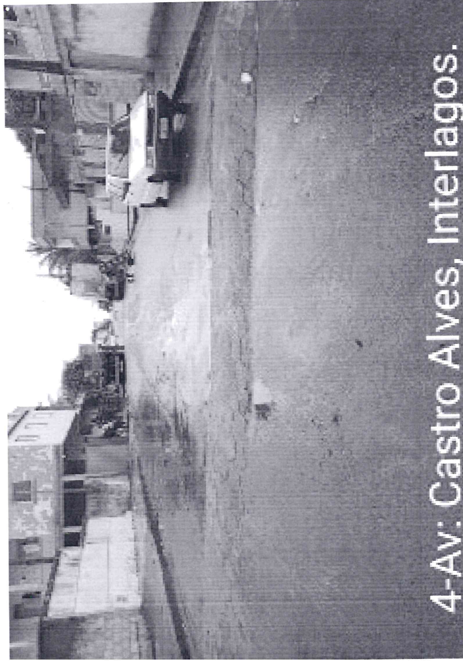
4-Av: Castro Alves, Interlagos.