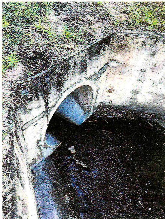
Rede de drenagem com lançamento intermitente mesmo em dias não chuvosos